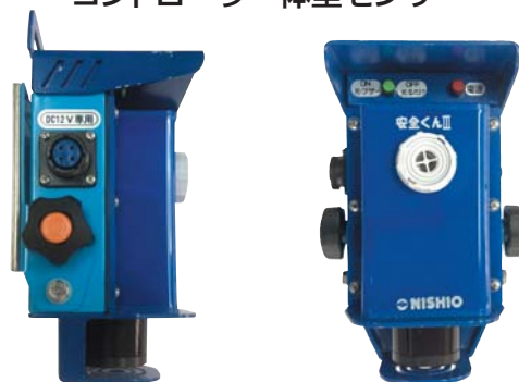
コントローラー一体型センサー