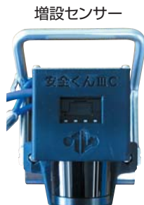
※エリアパターン数は変わりません