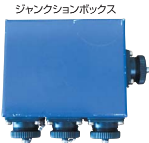
※センサーを増設する場合に必要となります