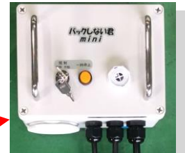
操作方向規制装置